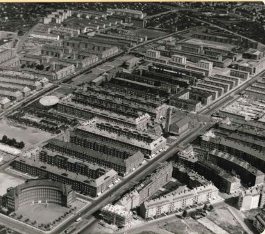
Luftaufnahme von 1955.

„75 Jahre Dulsberg“, so empfängt Sie das Deckblatt. Als aufmerksame*r Leser*in runzeln Sie die Stirn und fragen sich: Ist der Dulsberg nicht bedeutend älter?