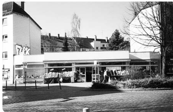
Einzelhandel am Dulsberg.