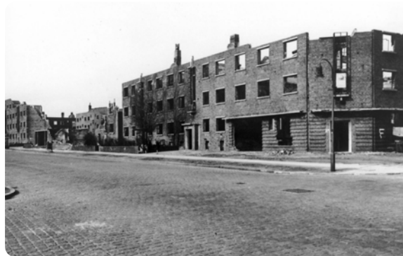
Der im Krieg zerstörte Naumannblock.