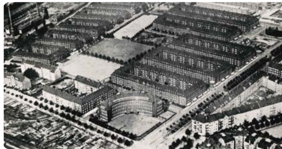
Luftaufnahme vor 1943.