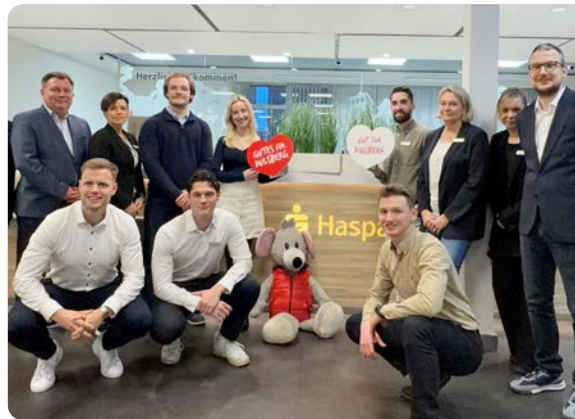
Belegschaft der HASPA-Filiale in Dulsberg.

HASPA-Filiale in Dulsberg, Straßburger Straße 38