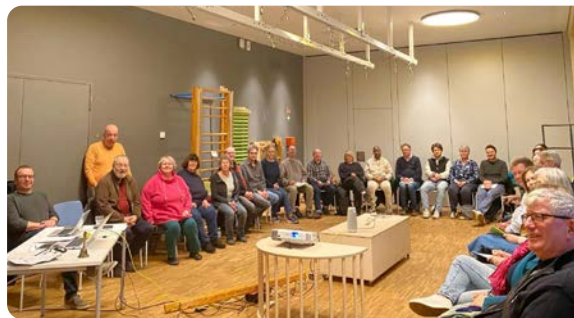
Teilnehmende der Sitzung am 3. März 2026.

Ort: Kulturhof Dulsberg, Alter Teichweg 200