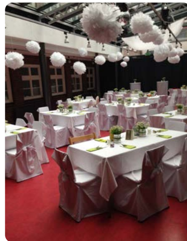
Kulturhof im Feierlook.