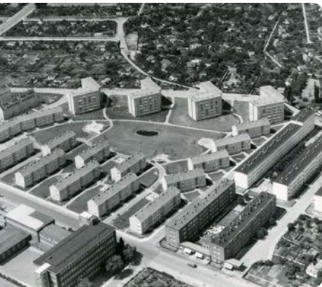
Luftbild der neuen Wohnsiedlung.