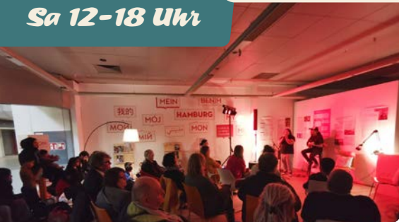
Eröffnungsfeier Pop-up-Raum (Steilshoop).

Viele Perspektiven der Stadtgesellschaft fehlen im Museum. Das wollen wir mit dem Projekt „Mein Hamburg! Erzählst du uns deine Geschichte?“ ändern. Dafür sind wir vom 5. bis 23. Mai 2026 mit einem Pop-up-Raum in Dulsberg! Erzähl uns, was dich mit Hamburg und Dulsberg verbindet: Wo fühlst du dich zu Hause? Was soll blei-