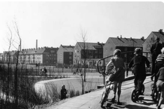
Spielplatz Rollerbahn im Grünzug Dulsberg.