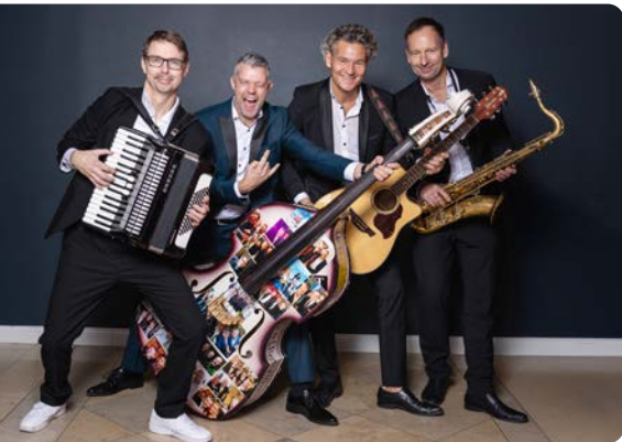
Das Lopes Duo.