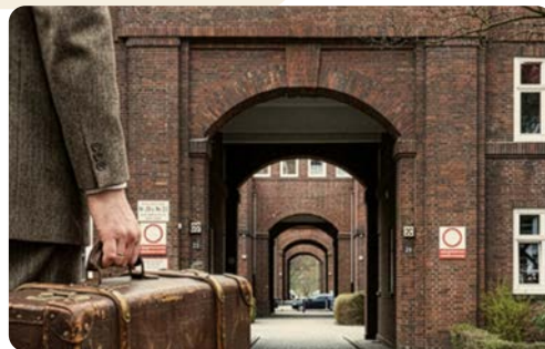
Gastarbeiter steht vor Torbogen auf dem Dulsberg.

Veranstalter: Barmbek-Dulsberg Solidaritätsverein (DIDF)